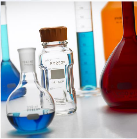
Material de vidrio para laboratorio