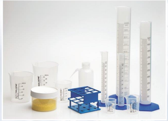
Material de plástico para laboratorio