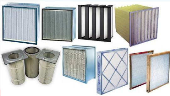
Repuestos y consumibles.