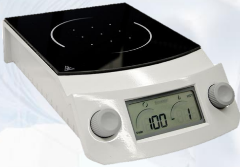
Placas de calentamiento y agitación