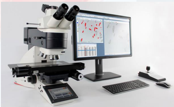
Microscopios, Estereomicroscopios, Equipos ópticos en General