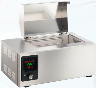
Baños de María, Termostatados .