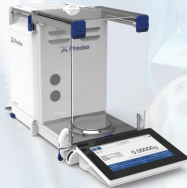
Balanzas Analíticas, de Precisión