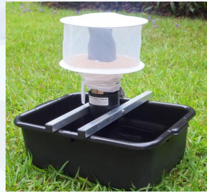
Recolección de muestras