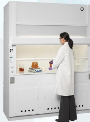
Cabinas de Extracción, Flujo Laminar