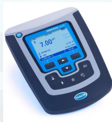
Equipos para Mediciones Electroquímicas